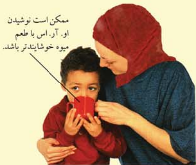
جبران مایعات از دست رفته فرزند خود را تشویق کنید که حداقل هر ساعت مقداری از محلول جبران کننده کاهش آب بدن یا آب میوه صاف شده بنوشد. همچنین وی باید بلافاصله پس از استفراغ باز هم از محلولهای فوق بنوشد.

در صورتی که اسهال پس از ۲۴ ساعت همچنان ادامه پیدا کرد، به پزشک خود مراجعه کنید.