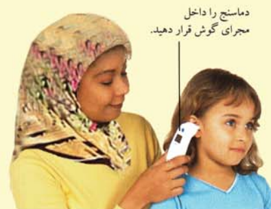
دماسنج را داخل مجرای گوش قرار دهید.

یکی از راههای راحت اندازه گیری دمای بدن کودک، استفاده از دماسنج گوشی است که آن را در مجرای گوش قرار می دهند. همچنین می توان از دماسنج های معمولی که در زیر بغل یا داخل دهان قرار داده می شوند، استفاده کرد. هرگز دماسنج های شیشه ای را در دهان کودکان زیر ۷ سال قرار ندهید. برای توضیح نتیجه خواندن دماسنج زیر بغل، ۶/۰ درجه سانتیگراد به عدد خوانده شده اضافه کنید.